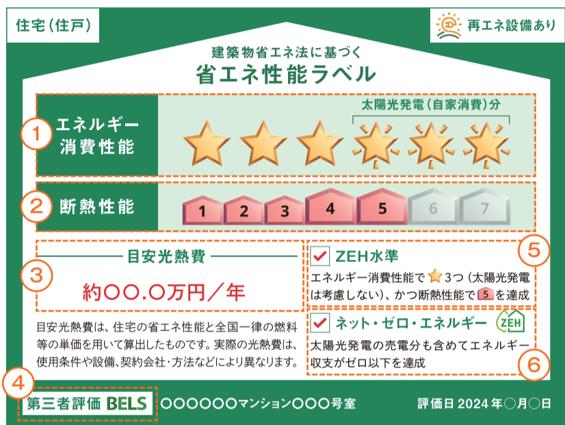
▲第三者評価による住宅（住戸）のラベルの場合