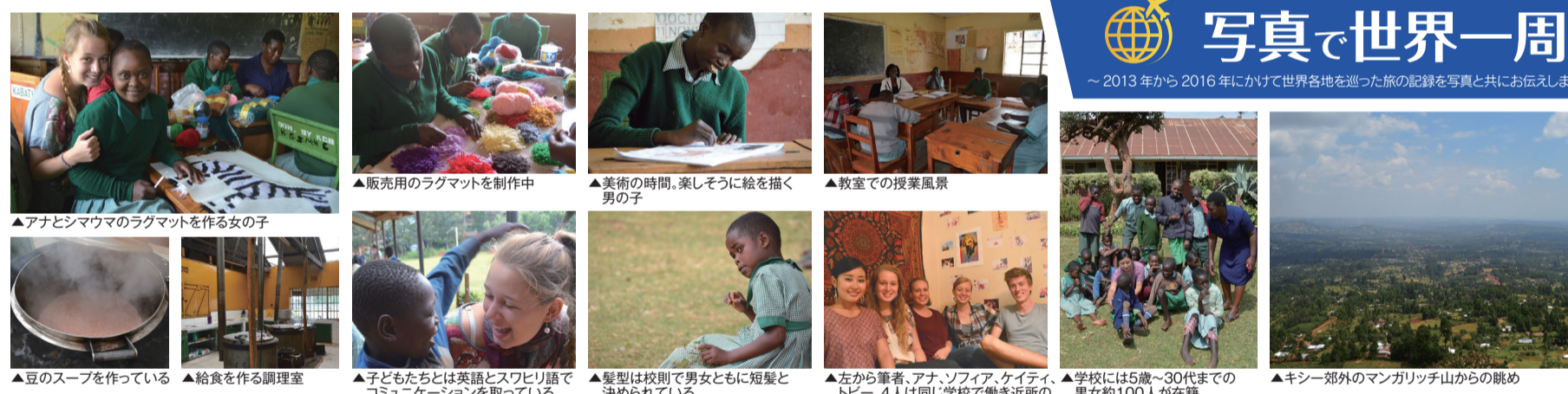
▲アナとシマウマのラグマットを作る女の子

～2013年から2016年にかけて世界各地を巡った旅の記録を写真と共にお伝えします～