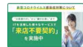
▲日本エイジェントの非接触サービス

コロナ騒動より前から、独自に「ウェブ接客」や「オンライン内見」を導入していたのは日本エイジェント（愛媛県松山市）だ。この1〜3月の繁忙期は、非接客を推奨していることが後押ししたのか、前年に比べ来店客も仲介件数も増加したという。