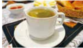
▲南米で日常的に飲まれているココア茶