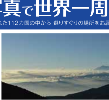
▲眼下に広がる雲海