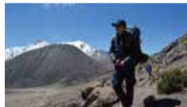
▲登山口～ベースキャンプ間の山道