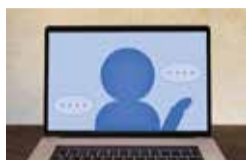
▲来店せずに話ができるリモート接客

リモート接客とは、実店舗に行かずに接客すること。電話での接客はもちろんだが、最近では、電話では顔の表情などが見えづらいため、ビデオ会議システムやテレビ電話などを使用して行うことが多いようだ。「Zoom」や「Skype」、