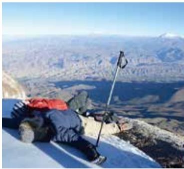
▲山頂の一步手前付近