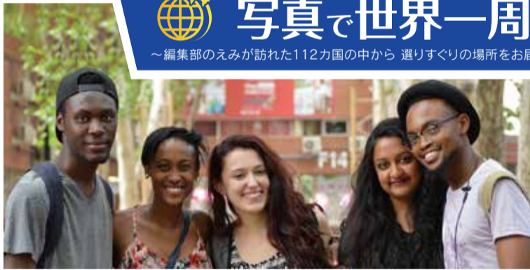
▲様々なルーツを持つボチェフストローム大学の学生(ボチェフストローム)