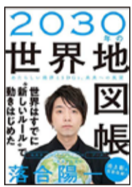
『2030年の世界地図帳 あたらしい経済とSDGs、未来への展望』 SBクリエイティブ 落合陽一(著)

未来を予測するためのデータには、様々なものがあります。二つ言えるのは、これからの社会は今までは全く違ったルールによって営まれるということ。これから世界はどこに向かっているのか、世界の課題点を掘り下げると同時に、今起こりつつある変化について著者「落合陽一」が語ります。