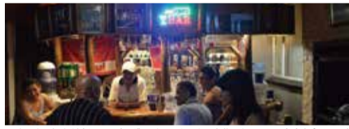
▲もてなし好きが高じてリビングにバーカウンターを作ったホストの自宅(ブレイリア)