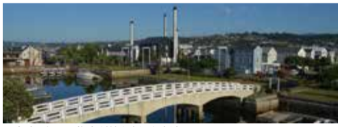
▲水路に沿って住宅が並ぶ(ナイスナ)