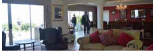
▲内装はヨーロッパスタイルが主流(ポートエリザベス)