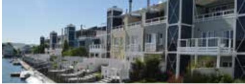
▲各戸の前に設けられたボートの停泊場(ナイスナ)